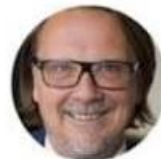
PÅ GULLÖ HÖR