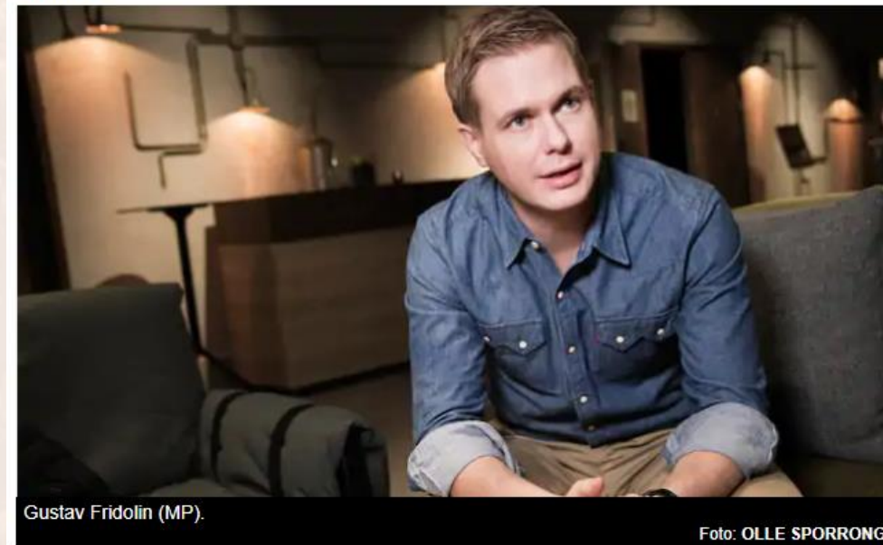
Gustav Fridolin (MP).