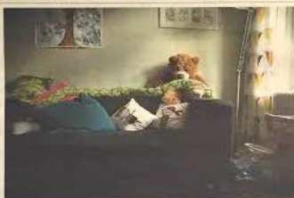
Bild från Alla kvinnors hus i Stockholm. "Landets kommuner står nu inför ett val: att rasera eller förjuga relationen med de ideella kvinnojouurer".

A ntalld personlig dygnet runt, året om. Säkerhetsdörrar, lämningsbesök, insynsbyrå och videokameravakning. Exemplet är hämtade från Botkyrka kommuns konceptifikation i en upgående upphandling av skyddat boende för våldutsatta personer. Den långa listan kräver en personlighet och starka kvaliteter som behåller ideella kvinnojouurer från att delta. Dygnet runt bemanning och skåpkydd är omöjliga för den stora majoriteten kvinnor och barn som bor på skyddat boende. Det kan till och med vara kontraproduktivt i processen att lägga märke över en egen liv. I stället är utifrån kvaliteten av hjälpa. Kvinnojouurer är den akter som har långt erfarenhet och ett starkt nätverk på området, och kvaliteten på jourerna ofta har överlägsna i granskningar. Uppförande nog är Botkyrka upphandling, enbart värd på den och inte kvaliteten. Den är en upphandling i hela kvadraten och är tillgänglig för alla upphandlingar och är upprägnat. I ett svep utesluter alltså kommunen de ideella kvinnojouurer, till förmån för andra vårdkoncept som Attendo och Capio som är de enda som kan pressa priset.